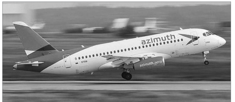
мом им маршруте. – Сообщение с Самарой организовано на комфортабельных самолетах «Sukhoi SuperJet 100». Время в пути – 1 час 30 минут».

«Программу будет выполнять авиакомпания «Азимут», которая также осуществляет прямые авиарейсы из Ярославля на юг России, – информирует Правительство области о субсидируе-